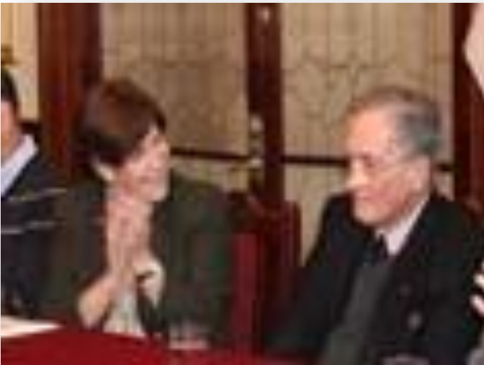
Susana Villarán, Alcaldesa de Lima

“Muchos de los problemas que hoy afectan, agobian y generan impaciencia en los vecinos, tienen que ver con la crisis de una ciudad que está desbordada, (...) y que no ha pensado su desarrollo”.