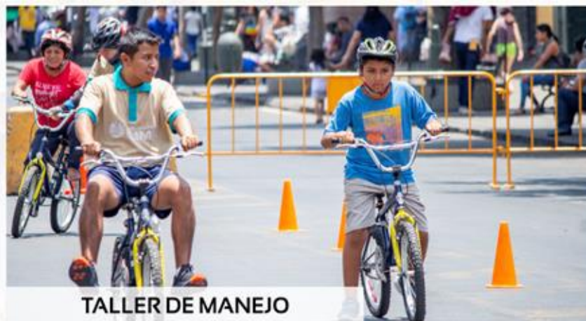
TALLER DE MANEJO