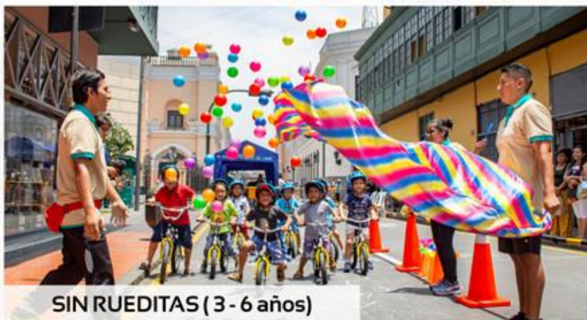
SIN RUEDITAS (3 - 6 años)