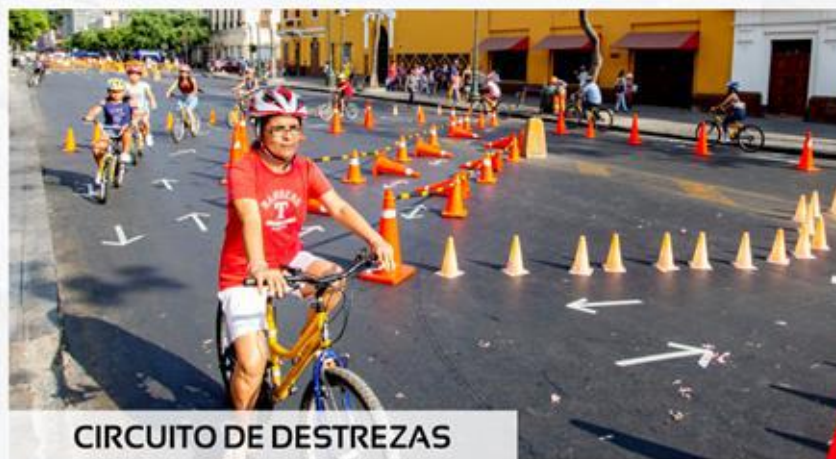
CIRCUITO DE DESTREZAS