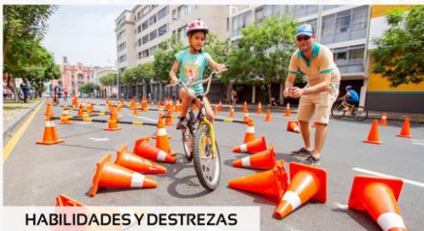
HABILIDADES Y DESTREZAS